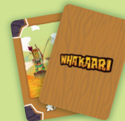
70 Carte Azione