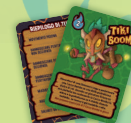
8 Carte Personaggio