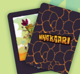
30 Carte Evento